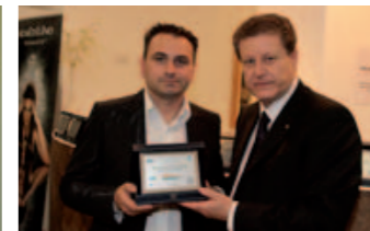
NP Serramenti Srl