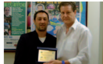
Agenzia Gatto Pratiche auto