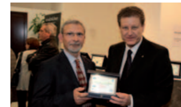
Corona Alberto Srl